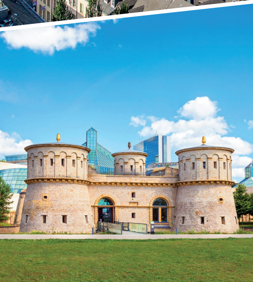
Mudam-Museum, gebaut nach den Plänen des chinesisches-amerikanischen Architekten Ioh Ming Pei und das Festungsmuseum „Dräi Eechelen“

Ihr lokaler und erfahrener Guide wird mit Ihnen zusammen den Reichtum und die Geheimnisse der Stadt Luxemburg erkunden. Erfahren Sie mehr über die interessanten Fakten der Stadt mit ihrer einzigartigen Geschichte, ihren Bewohnern und Traditionen. Genießen Sie eine 2-stündige Tour durch die Hauptstadt mit den schönsten Ecken und Sehenswürdigkeiten der Innenstadt: Place d'Armes, Platz der Verfassung, Regierungsviertel, Corniche, Millenniumsdenkmal, Altstadt, Großherzoglicher Palast (außen), Platz Guillaume II, u.v.m. Mittagessen (gegen Gebühr) in einem typischen Restaurant in der Stadt.