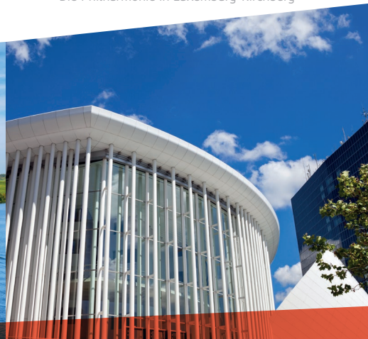
Die Philharmonie in Luxemburg-Kirchberg

Das Luxembourg Science Center ist ein brandneues Zentrum für Wissenschaft und Technologie