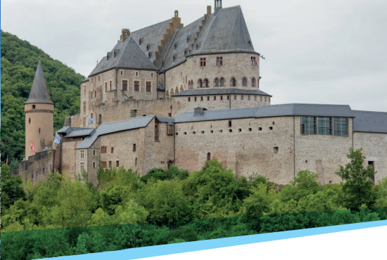
Das Schloss Vianden