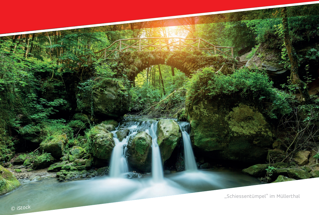
„Schiessentümpel“ im Müllerthal